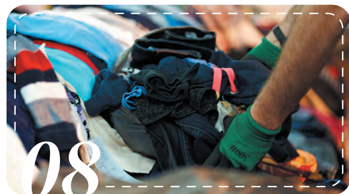
CO2を低減したりサイクル方法

弊社の管理手法は ”物を大切に”という ”想い”から生まれた 管理手法で、特許 【特許業3041335号】を 取得した誇りの 管理システムです。