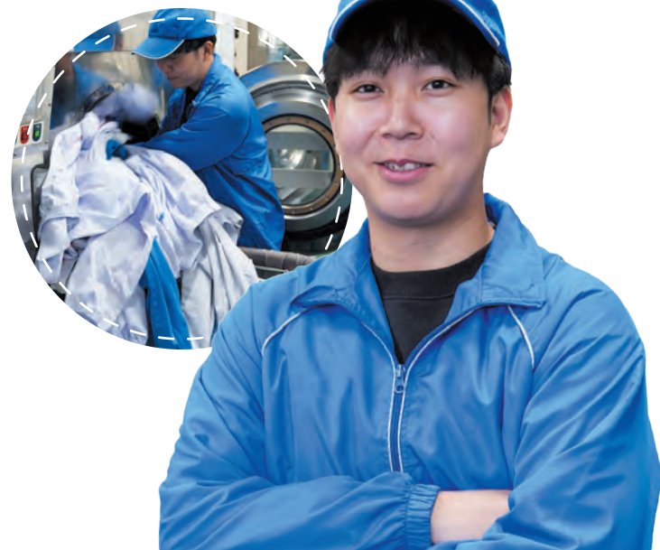
業務課 S.A 2022年入社

新たな挑戦としてクリーニング業界に挑みました。衣類の検品や洗浄、仕上げを通じて、お客様に喜ばれる瞬間にやりがいを感じます。不安があっても、頼れる先輩が多いので安心です。支え合いながら、一緒に成長していきましょう！