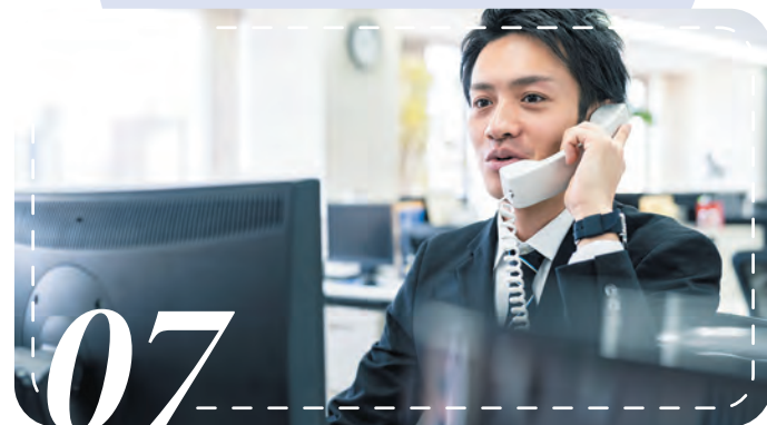
【管理部】お客様からの問い合わせ対応

商品の企画・製作から販売方法も 買取・リース・レンタルといった お客様の業態・用途により、より良い 販売方法を選んでいただけます。 また、サービス方法も保管・在庫 管理・補正・修理・クリーニング・ 集配達・入退社の管理といった ユニフォームに関する全ての業務を 部分的に切り分けて、よりコストを 下げてご提供する事も可能です。 そして最後に廃棄もリサイクルする 方法への提案も行っています。