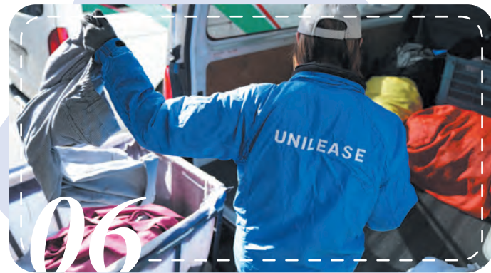
【配送課】ユニフォーム納品・回収

これらの管理は、主に布製バーコードを 使用し、他には要望によりICタグも 使用して、廃棄に至るまでの動向管理を 行っています。