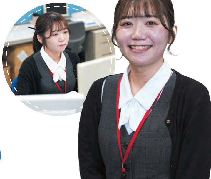
商品部 O.T 2023年入社

面接や総務の柔らかな雰囲気は惹かれ、地元で事務職をしたくて入社。午前は発注業務、午後は資料作成や発送を担当しています。社員同士の距離感が近く、仕事後に同期とカフェ巡りや食事を楽しんでいます。就職活動では直感を大切に、学生生活も楽しんでください！