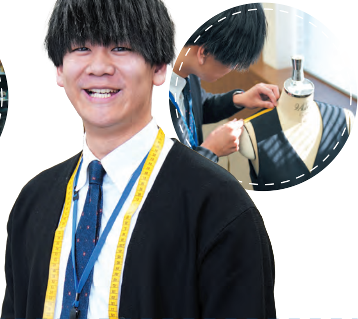
営業支援部 N.T 2020年入社

アパレル業界未経験でユニフォームに興味を持ち入社。営業支援やデザイン作成を担当し、お客様の笑顔を思い描いて仕事に取り組んでいます。定時退社や休暇の取りやすさが魅力の職場です。就職活動は未来への第一歩。学生生活を全力で楽しんでください！