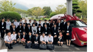
企業見学バスツアー