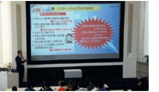
インターンシップガイダンス