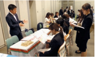
インターンシップマッチングフェア