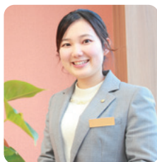
人間生活学部 2020年卒

A:一番大切にしていたのは「人間関係」でした。インターンシップ先で、上司と部下がフランクに話をしている...そのような会社であれば、長く働くことができると思ったことが入社の決め手です。